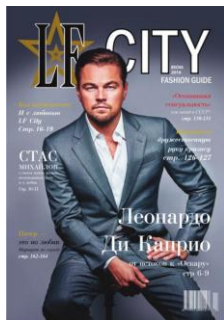
Leonardo Di Caprio Primavera 2016