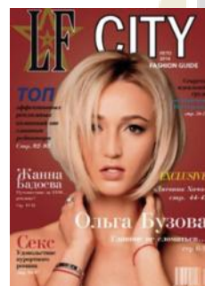
Olga Buzova Estate 2016